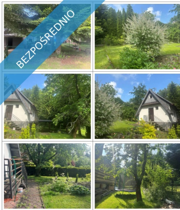
Ogródek działkowy nr 36, ROD Gajówka w Gaju