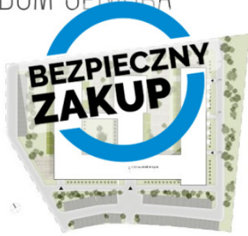
ZAGOSPODAROWANIE TERENU SKALA 1:500