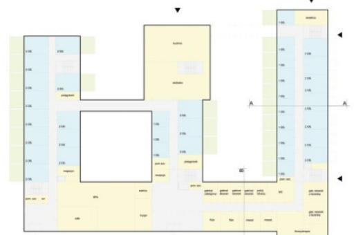
POZIOM 0 SKALA 1:250