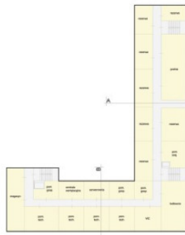
POZIOM -1 SKALA 1:250