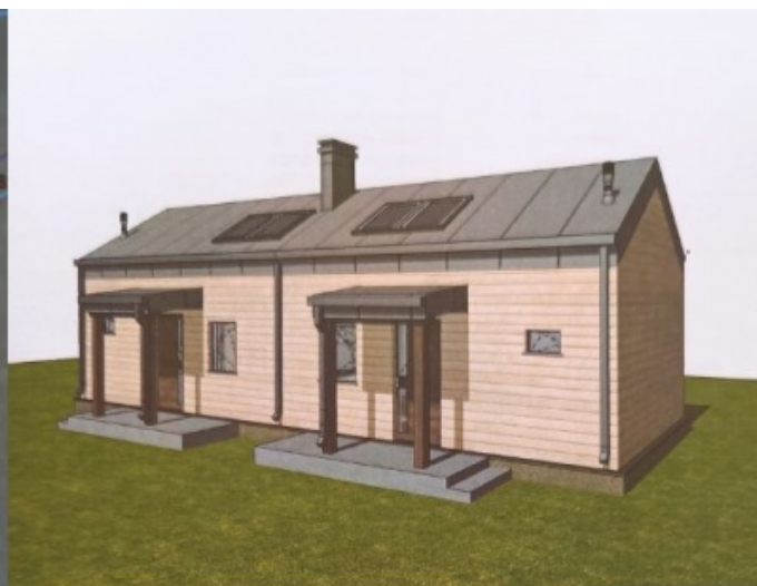
PERSPEKTYWA WIDOK OD FRONTU